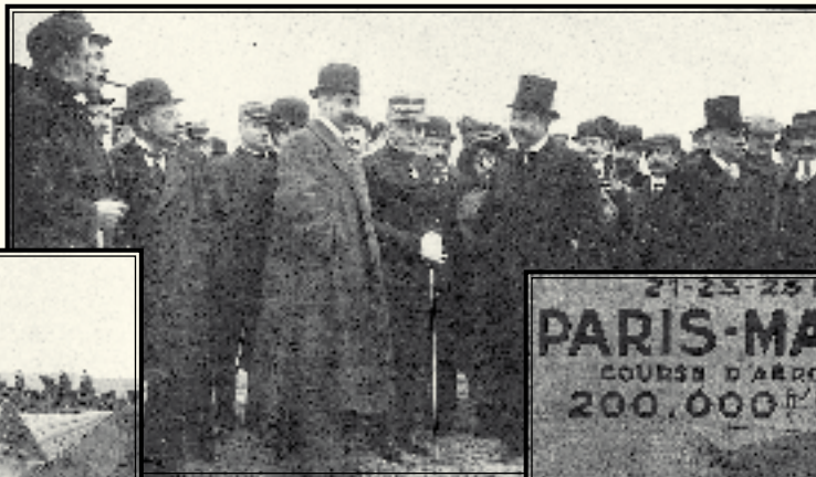
Grupo de autoridades sobre el que cayó el aparato.