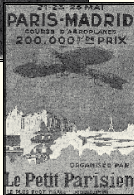
Cartel anunciador de la carrera.