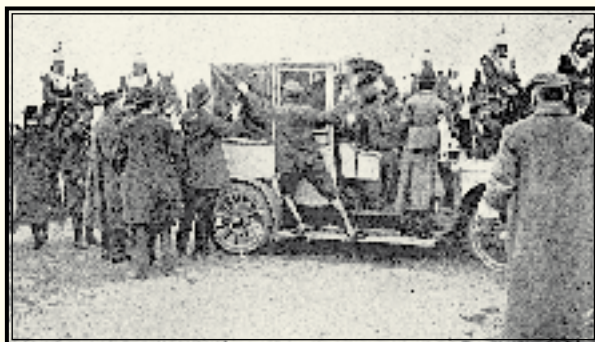
Momento de partir el automóvil que conducía, herido de gravedad, al presidente del Consejo, Sr. Monis.