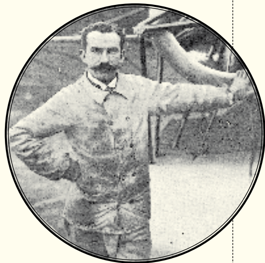
El aviador Train, causante del accidente, en su aparato E. Train-Gnome.